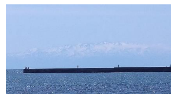
珠洲内浦からの立山連峰