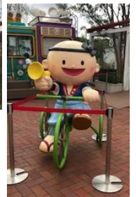
うなぎパイファクトリー

静岡へ姪っ子の吹奏楽の応援に行って来ました。ついでに出世城と言われる浜松城へ。小さいとはいえお城って迫力ありますね！